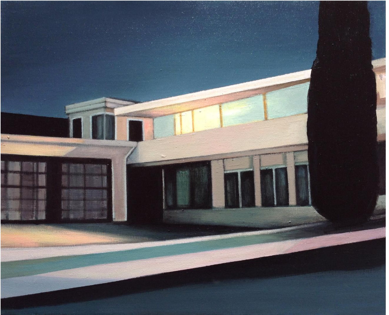
Mulholland Drive, 2021

Acrílico sobre lienzo , 46 x 38 cm. 550 €