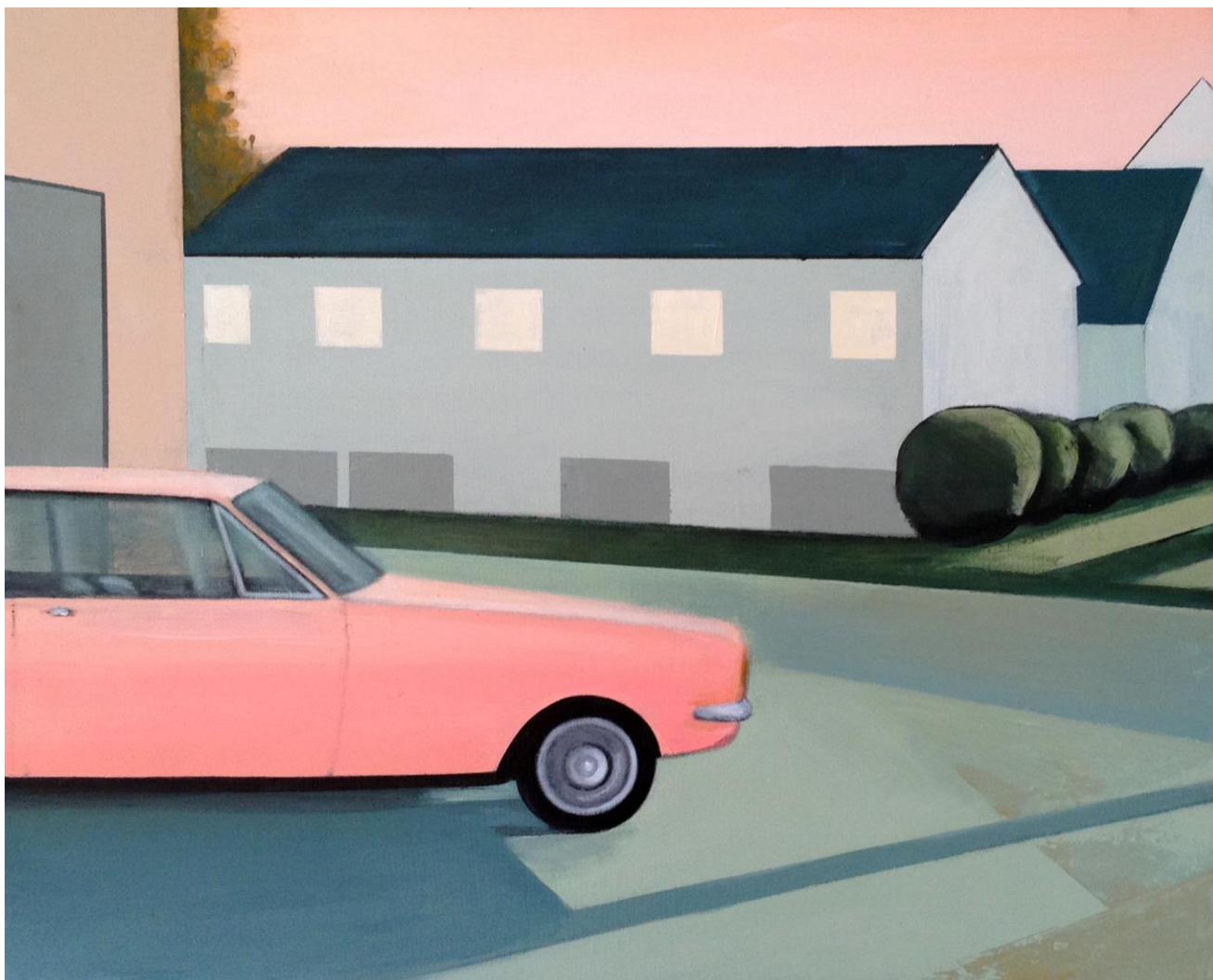
Neighborhood n°1, 2021

Acrílico sobre lienzo , 61 x 50 cm. 720 €