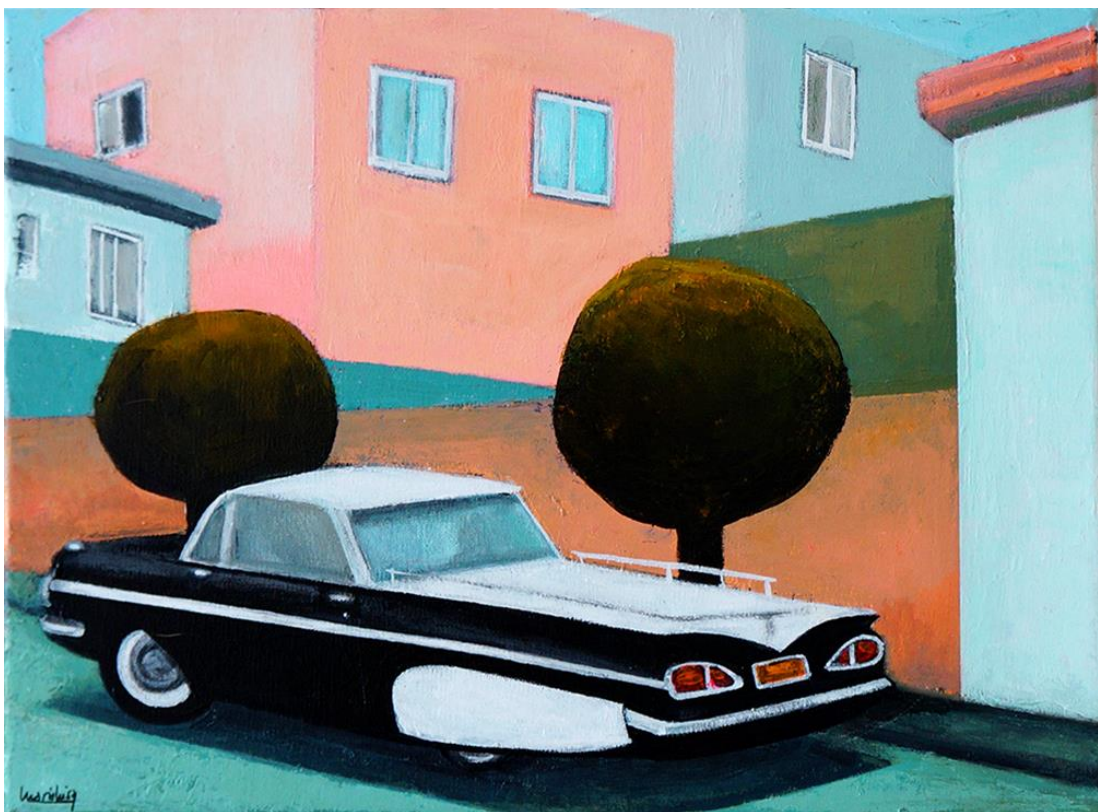
California Dreamin' n4, 2019

Acrílico sobre lienzo , 27 x 22 cm. 350 €