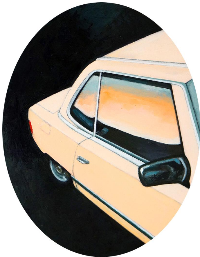
California Dreamin' n15, 2019

Acrílico sobre lienzo, 40 x 50 cm. 500 €