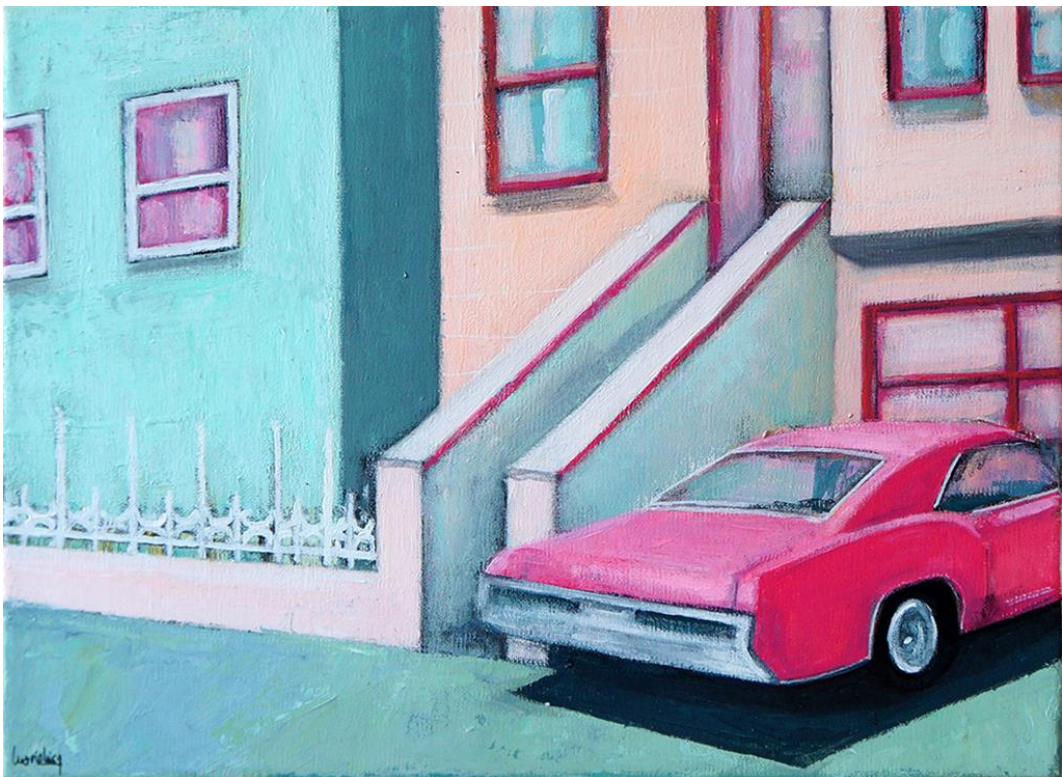
California Dreamin' n1, 2019 Acrílico sobre lienzo, 32 x 23 cm. 350 €