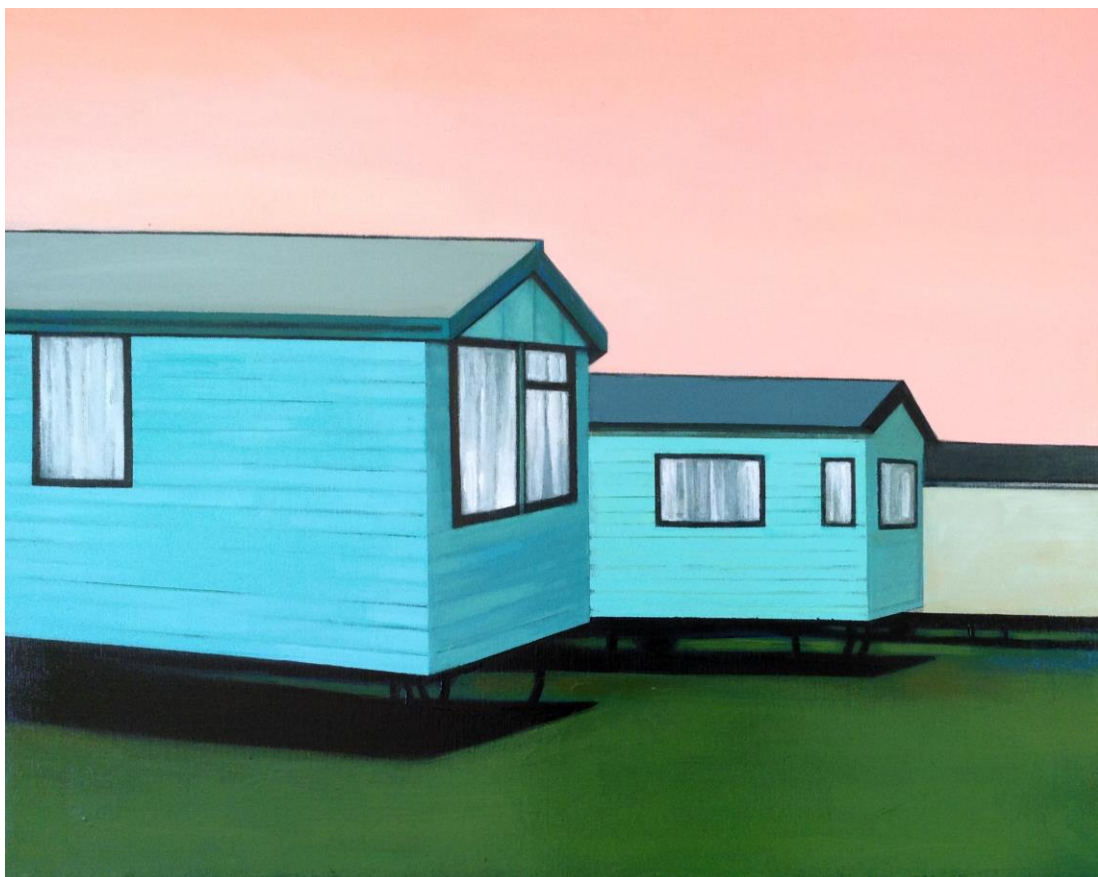
Nomad Life, 2021

Acrílico sobre lienzo, 80 x 65 cm. 950 €