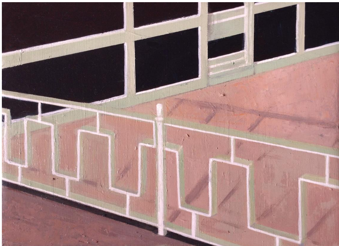
Over the railing, 2021

Acrílico sobre lienzo , 46 x 38 cm. 550€