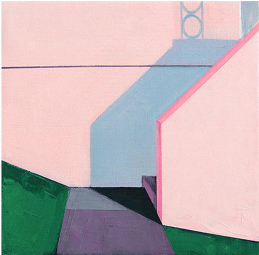
Dead End, 2021

Acrílico sobre lienzo, 40 x 40 cm. 500 €