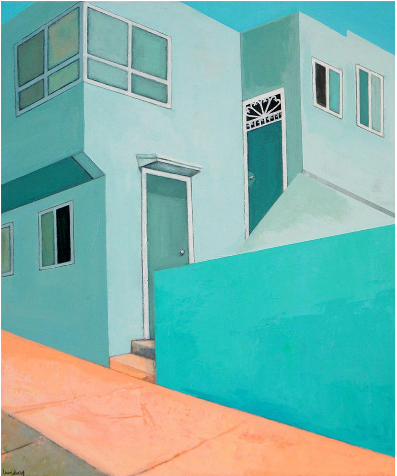
California Dreamin' n10, 2020. María Luisa Beneytez

Acrílico sobre lienzo. 54 x 65 cm. 800 €