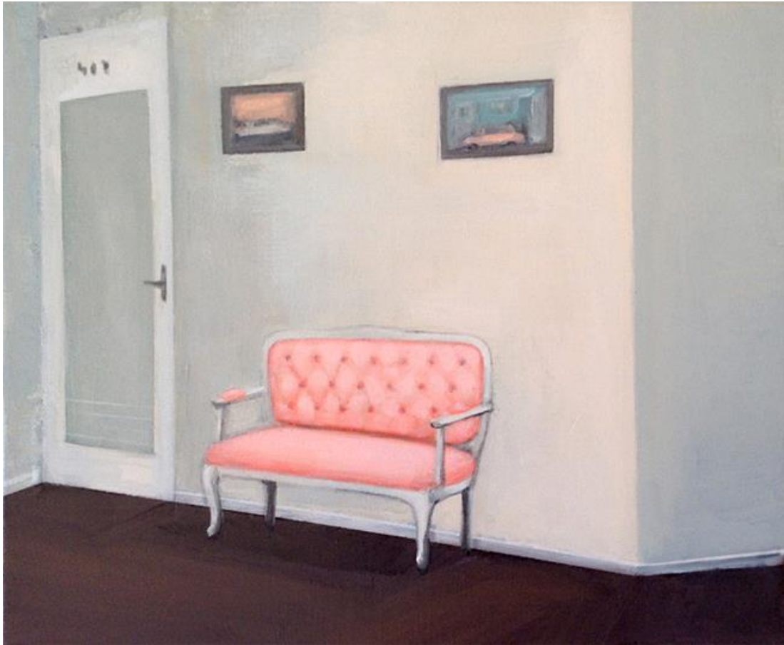
The waiting room, 2020

Acrílico sobre lienzo , 46 x 38 cm. 550€