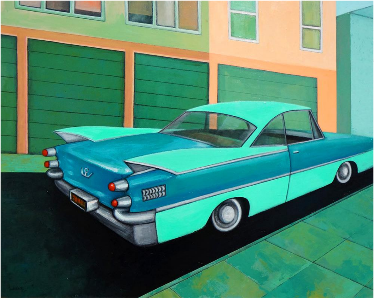
California Dreamin' n8, 2020 Óleo sobre lienzo, 92 x 73 cm. 1.100 €