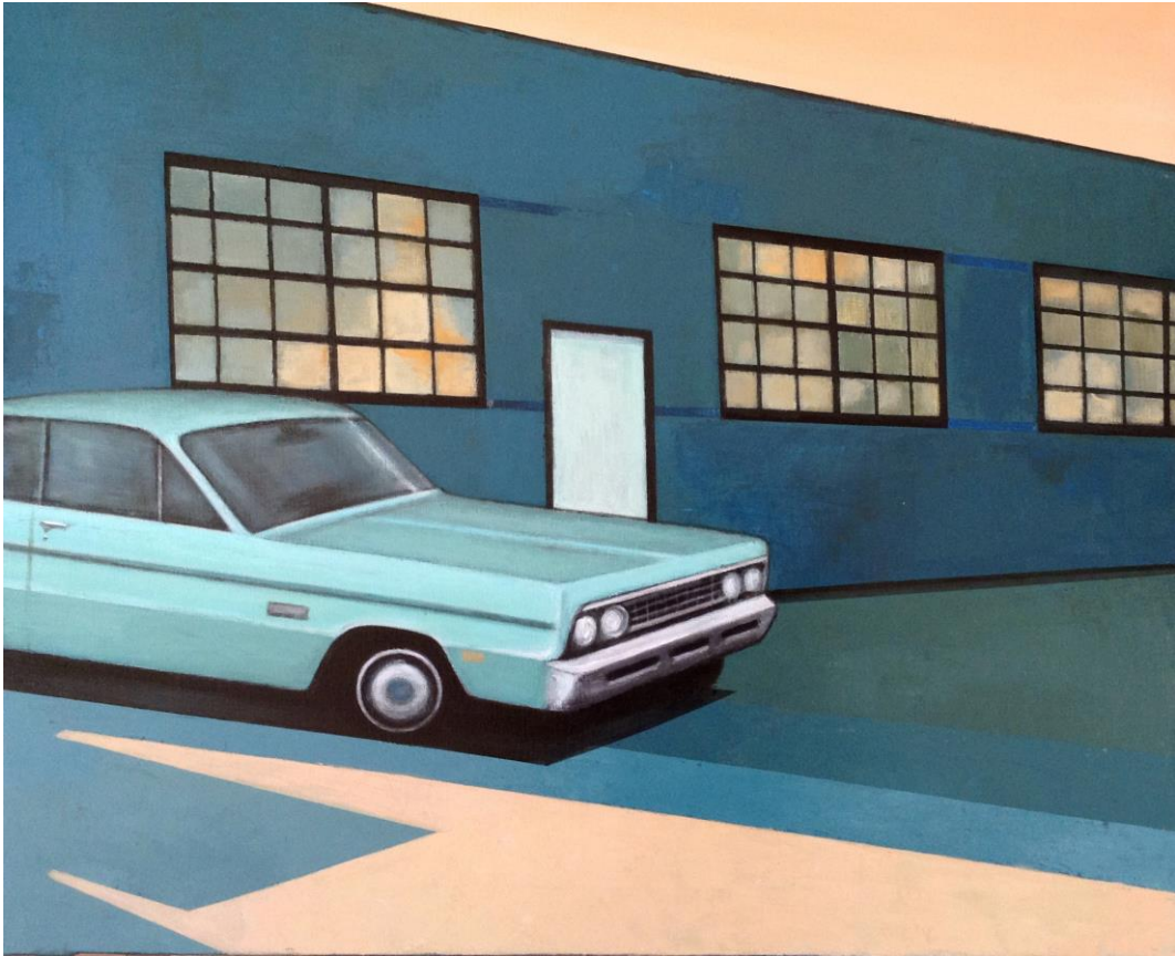
Old factory, Old car, 2020 Acrílico sobre lienzo , 72 x 60 cm. 720 €