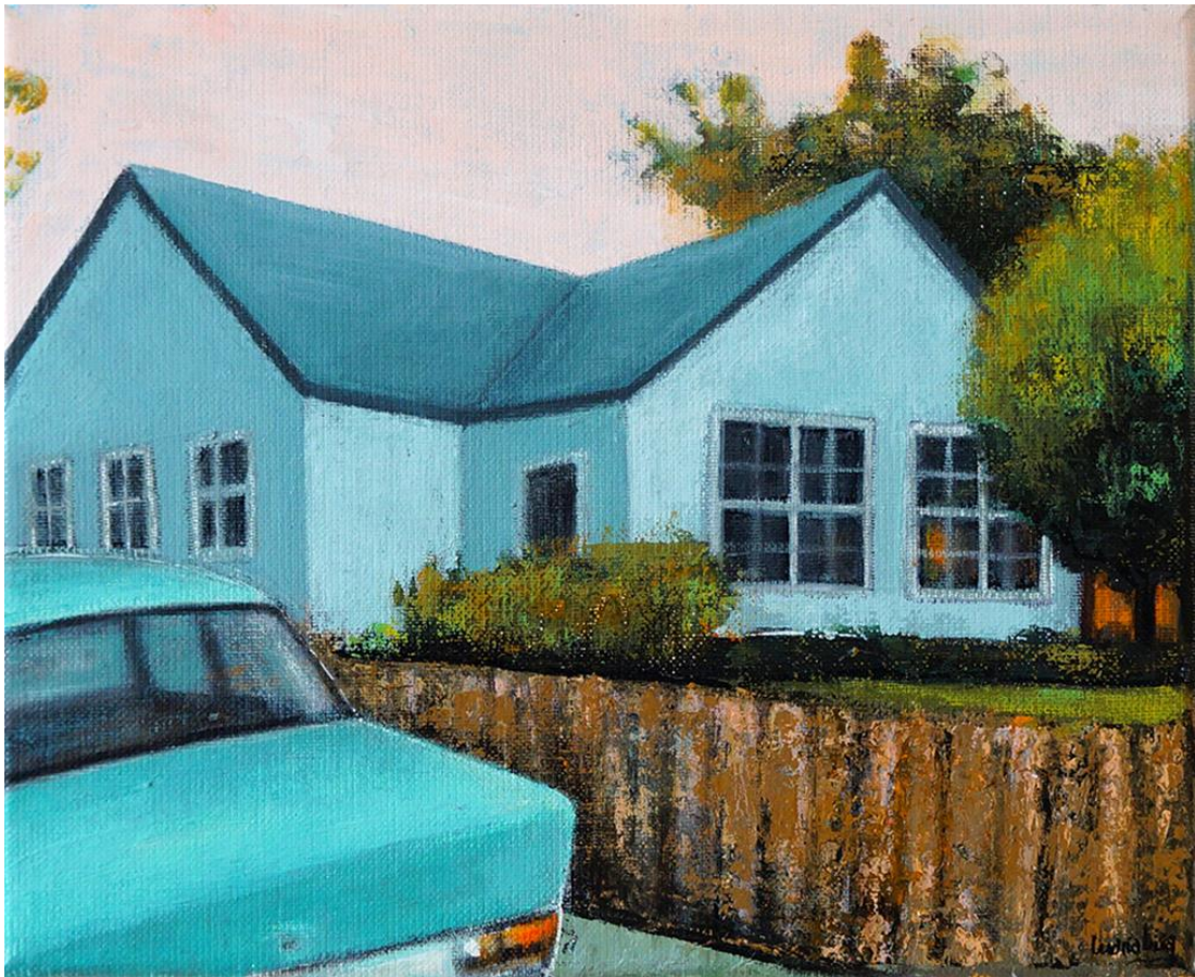
California Dreamin' n2, 2019

Acrílico sobre lienzo , 27 x 22 cm. 350 €